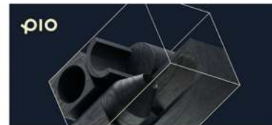
Marketing Specialist | Plo. Created by AutoStore

Ledelse - entreprenerskap - nettverksekonomi