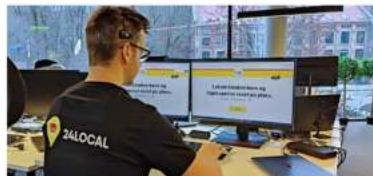
Daglig leder | 24LOCAL

Annonse på shifter.no/stillinger så lenge dere ønsker.