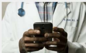
Sjelden sjanse til å være med i en ny norsk helsestartup

Vil du være med en gjeng ledende medisinske