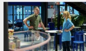
Business Developer - Future Nordic Marketplaces | FINN.no

Vil du være med en gjeng ledende medisinske